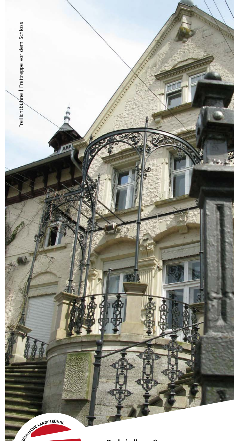
Freilichtbühne | Freitreppe vor dem Schloss

Sollten Sie dieses Programm per Post erhalten, können Sie sich jederzeit aus unserem Verteiler löschen lassen. Kontaktieren Sie uns dazu bitte unter der nebenstehenden Adresse bzw. Telefonnummer. Unsere Hinweise zum Datenschutz finden Sie unter www.theater-massbach.de/datenschutz .