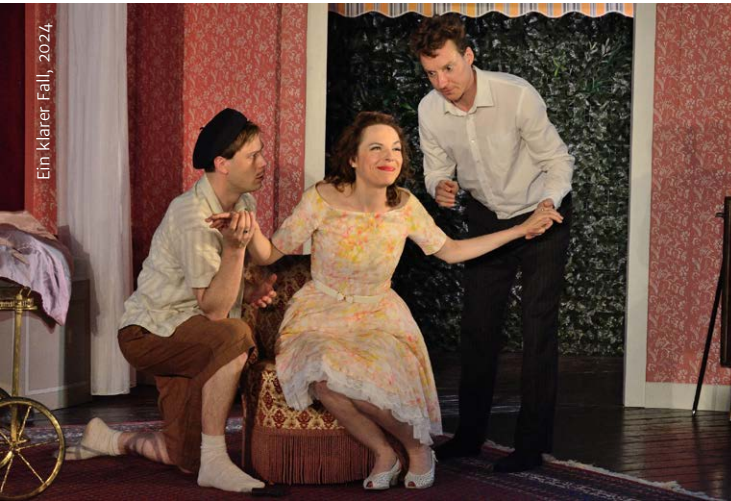
Ein klarer Fall, 2024.

Schloss Maßbach liegt am Hang des Schalksberges mitten im Grünen. Die Gartenfront mit Freitreppe und umwachsener Pergola ist eine schöne Hintergrundkulisse für die temporeichen und amüsanten Aufführungen. Ein ausfahrbares Regendach und eine Fußheizung sorgen auch an kühlen Tagen für ein ungetrübtes Theatererlebnis. In der Pause kann man im Schloss bei Kerzenschein und offenem Kamin den Abend genießen.